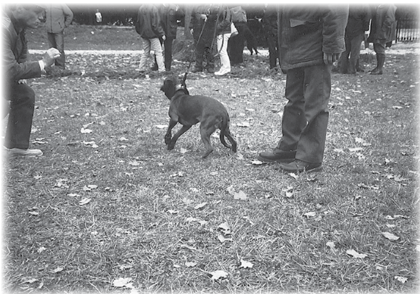
Bojazlivosť vyvolaná stresom z početnej diváckej i psej kulisy.

sudzovania. To potvrdzovalo tiež oprávnenosť Klubu domnievať sa, že náš chov bavorského farbiara, hlavne ale v poslednom čase rozširujúci sa chov hanoverského farbiara sú na vysokej exteriérovej úrovni.