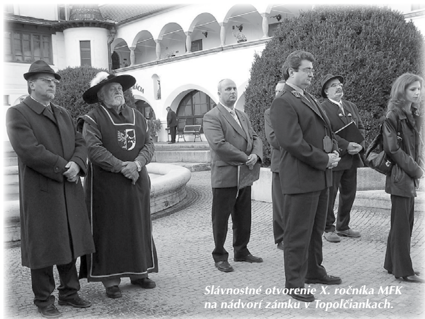
Slávnostné otvorenie X. ročníka MFK na nádvorí zámku v Topolčiankach.

Trojdnových skúšok sa zúčastnilo 9 psíkov, z pôvodne 11 prihlásených, s vodičmi zo siedmich krajín. Pre nás nepochopiteľná bola