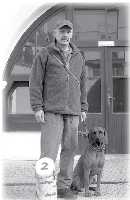
Vodič C. Ruts z Nemecka.