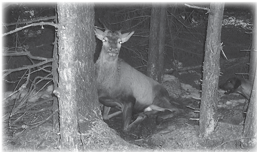
GANA Stanišovská dolina v záverečnej fáze IHF.