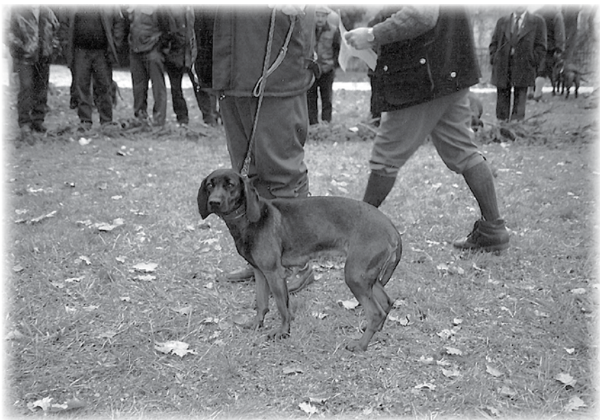
Predvážať psa je tiež umenie. Zlý postoj suky znehodnocuje celkovú kvalitu figúry.

nespúšťajú z neho oči, ako radostne a parádne dvíhajúc labky kráčajú a či bežia popri ľavej nohe vodiča a pri zastavení urobia výstavný postoj ukazujúc svoju figúru v plnej kráse.