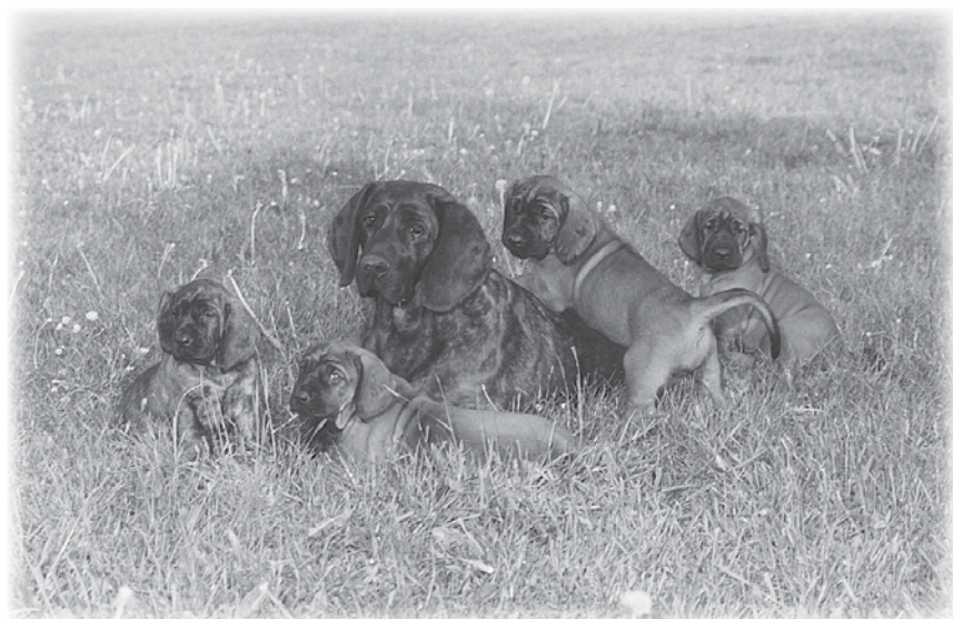
Vyrovnaný vrh HF – výsledok cieľavedomého chovu.