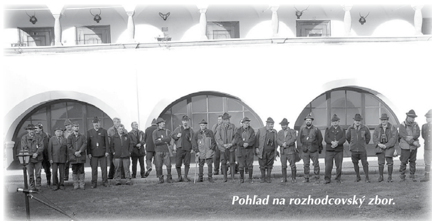
Pohľad na rozhodcovský zbor.