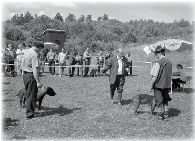
Záber z klubovej výstavy v Sielnici – 2005.