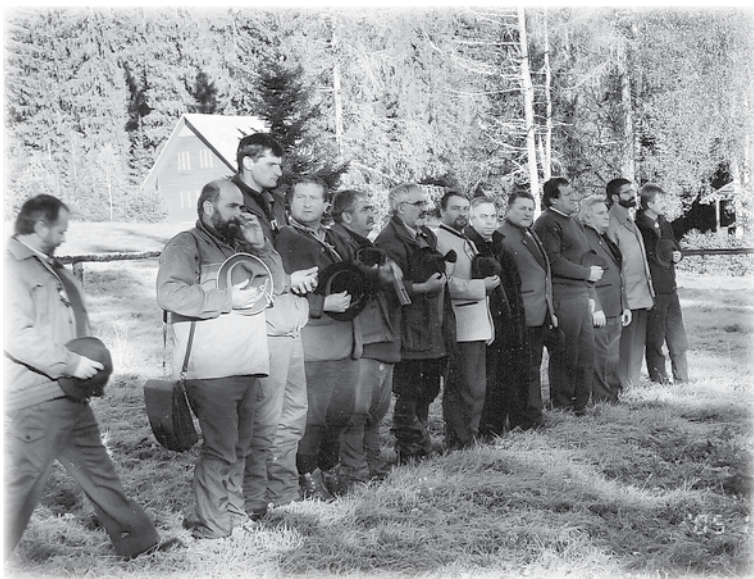
Pohľad na rohodcovský zbor a organizátorov.