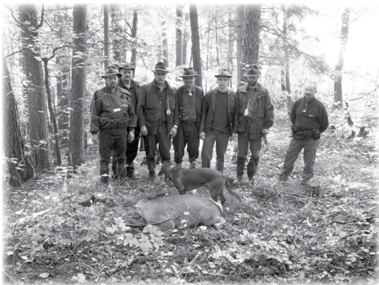
Záber zo Spišského pohára.

Musím sa priznať, že som od regiónov neočakával nijak zvlášť kvalitné súťaže. Nulté ročníky, aj keď ešte na umelých stopách však naznačili, že je to iná káva, ako naše výcvikové, či tzv. predskúškové dni. Ich komornú atmosféru, či spartanské podmienky vyvažovala srdečná spolupatričnosť nadšencov. Prichádzali na vlastné náklady do skromnej poľovníckej chaty a sami prispievali do spoločného hrnca i na slnkom a dažďom zošedivený stôl.