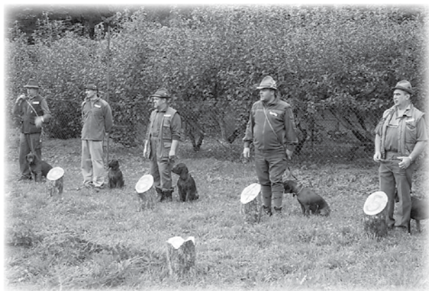
Účastníci nultého ročníka o Malokarpatský pohár.