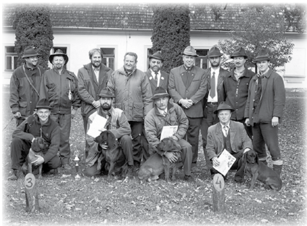
Rozhodcovia, organizátori a súťažiaci. Druhý zľava víťaz Spišského pohára.