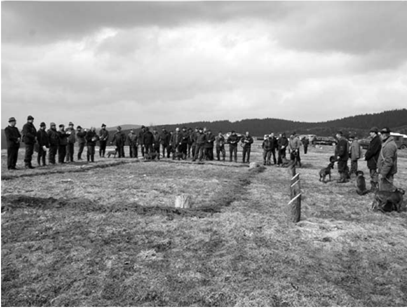
Zo slávnostného zahájenia Mútňanského pohára.

až mu farbiar prinesie zhod?) Že poľovníci majú záujem o takéto podujatie hovorí účasť vyše 50 členov, záujemcov o KCHF. Organizátori budú radi keď toto podujatie posluží aj ako námet pre iné oblasti, regióny alebo pre skupinu nadšencov, ľudí, ktorí chcú niečo pre našich štvornohých pomocníkov urobiť.