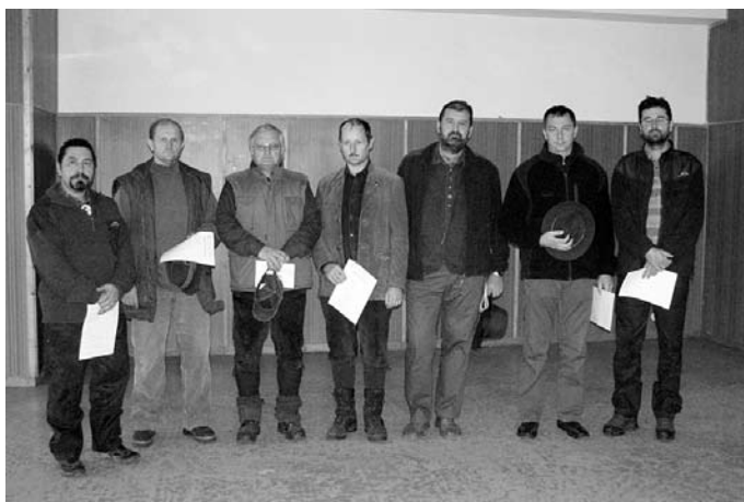
Budúci rozhodcovia pre skúšky farbiarov PF a IHF po úspešnom absolvovaní skúšok v roku 2008.

stopy bolo v rozmedzí 4–12 hodín a aj dĺžka iba do 400 m a tiež nemal možnosť zver durieť a stavať nakoľko bola uhyнутá.