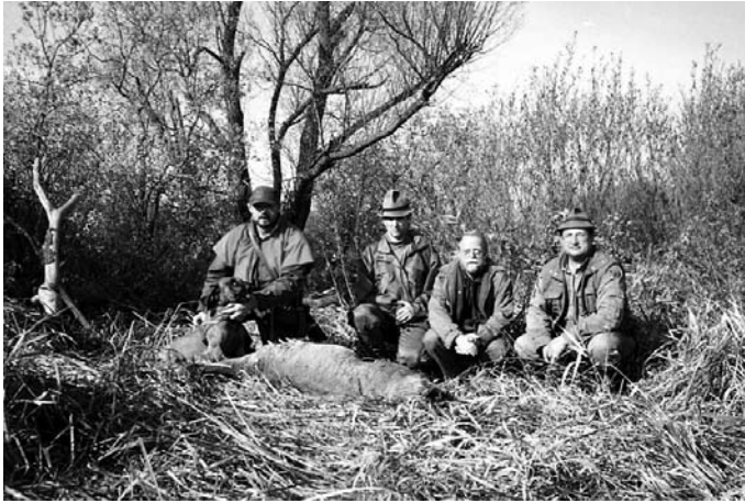
Vítaz XERO vom Wolfsborn s vodičom po úspešnej dohľadávke, rozhodcovia a člen PZ.