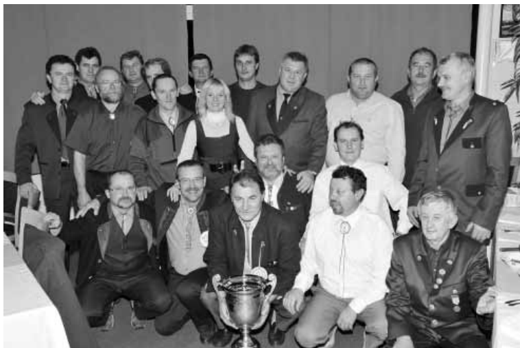
Pohľad na aktérov IV. ročníka Spišského pohára.

Suka pri posledke na voľno hodnotená známku 4. Nájdenie nástreľu 4. Na umelej stope suka pracovala ako vodič. Stopu vypracovala za 74 min. hodnotená známku 2. Čo ju zaradilo do III. ceny. Vodič na stope našiel jeden znak. Prirodzená stopa: bola to stopa nad 12 hod. na postrieľanom jelienčati. Suka bola na stopu nasadená po 16 hod.