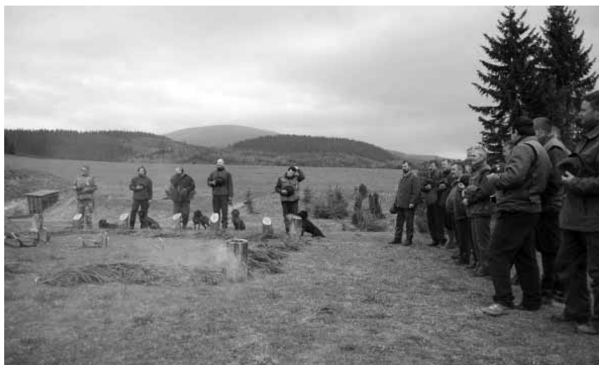
Nástup účastníkov pred vyhodnotením.

II. ročník Mútňanského pohára sa uskutoční 10.04.2010 v Mútnom. Na podujatí bude zmena skúšobného poriadku – náročnosť stopy, ktorú si vodič zvolí bude pokračovať čerstvým ležoviskom, na ktorom bude pes vypustený na durenie a stávanie preparátu zveri. Dohľadávka bude ukončená dostreloom domnelej zveri.