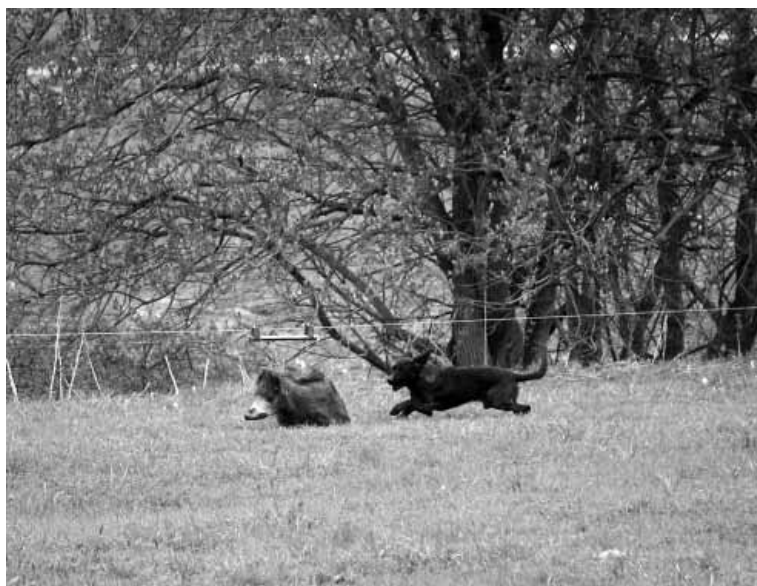
HF DOMIN spod Stohu pri disciplíne durenie a stavanie preparátu zveri.