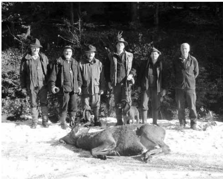
Po úspešnej dohľadávke jeleňa pod Babiou horou.