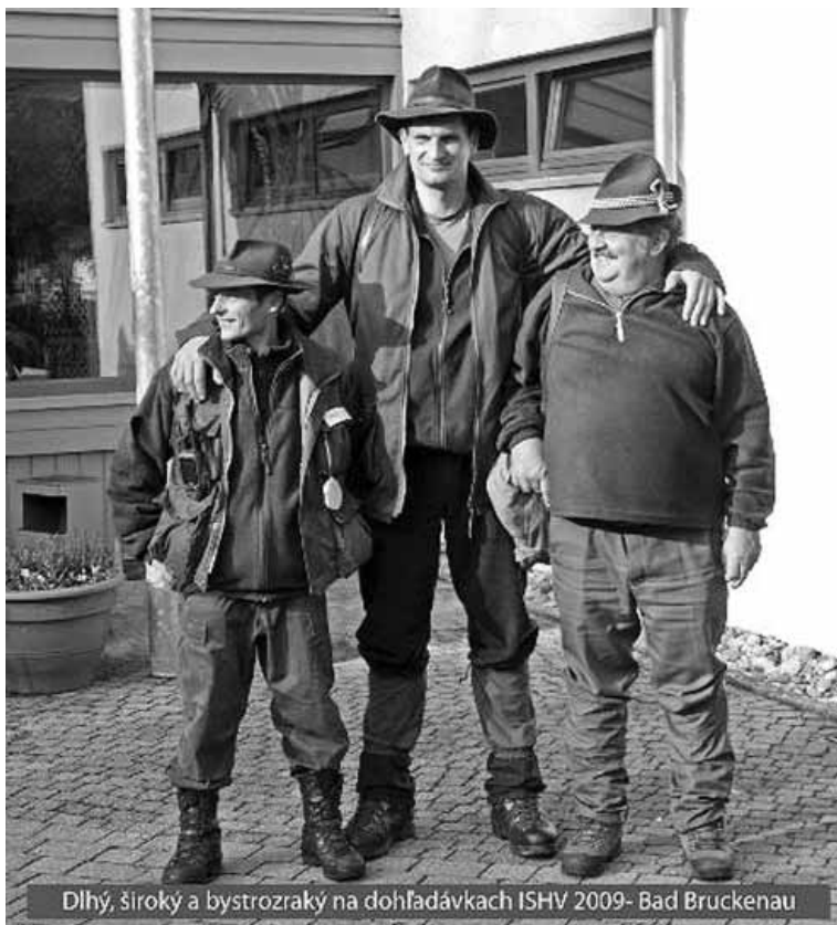
Dlhý, široký a bystrozraký na dohľadávkach ISHV 2009- Bad Bruckenau

Už na nástupe psododov z 12 klubov nastúpilo 19 vodičov, na stanovišti pre Slovensko bola zástava Rumunska. Po upozornení došlo