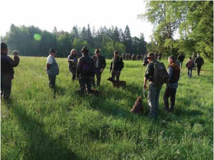
Pohľad na aktérov dohľadávok pred odchodom na prácu

Stopa – najväčšie prekvapenie sa konalo na stope, keď sme sa večer pred skúškami dozvedeli, že stopy sú založené za pomoci kamzičích ratíc a na konci bude kamzíča. Stopa bude dlhá cca 800 m s jedným