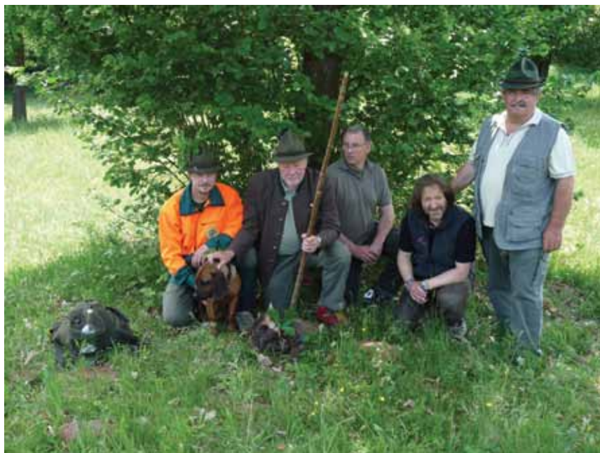
Dobre padne chvíľka oddychu v tieni po úspešnej dohľadávke

Bránenie úlovku: posledná disciplína – vodič odloží psa uviazaného asi 2 metre od dohľadanej zveri. Všetci musia odísť a po pár minútach sa rozhodca vráti pre dohľadanú zver. Pes by ho mal obrechať a zver