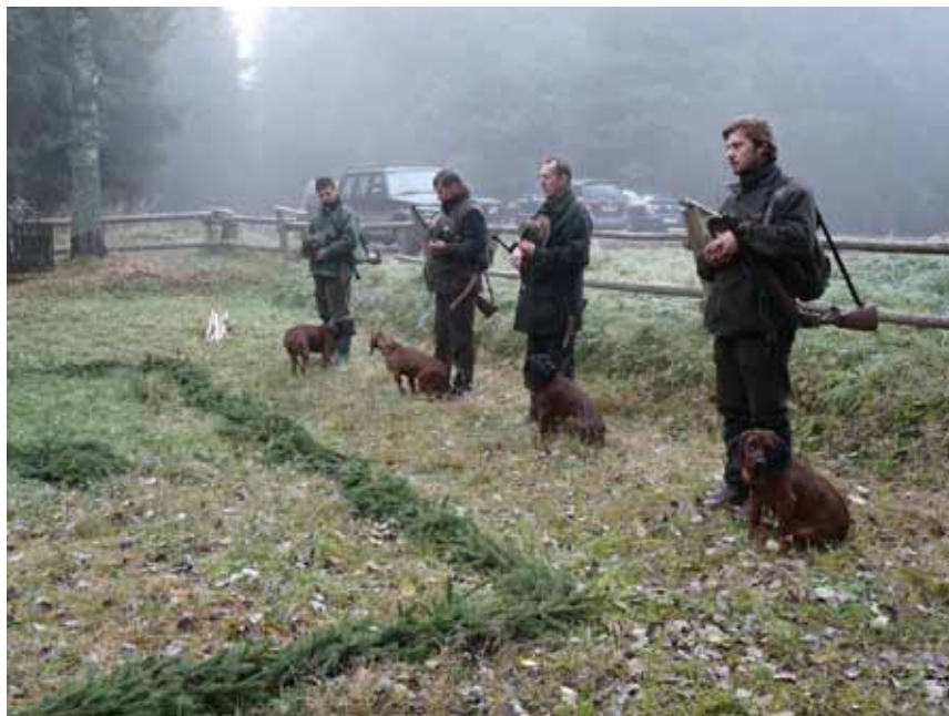
Pohľad na aktérov II. ročníka o Mútňanský pohár