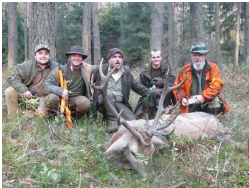
Jedna z úspešných dohľadávok na Memoriáli Benedykta Gierszewskiego

na svojich vibramkách. Asi v polovici poľa domáci dvaja poľovníci z korony cestou tam videli na hline farbu, ale miesto už nedokázali ukázať rozhodcom. Preto sa išlo na poslednú označenú farbu až do lesa. Z poslednej farby BORA vyrazila v smere, ale po chvíli sa skrútila oblúkom doprava a viedla nás popri ohrade dobrých 250m do borovicovej hustej mladiny, kde to bolo od diviacej zveri maximálne husto schodené, preryté. Boli tam ležoviská, množstvo trusu vytreté a zošúchané kmene mladých stromčekov. V tomto schodenom bludisku BORA skončila svoje účinkovanie na skúškach. Po prekonzultovaní práce rozhodcami sa uznal kus za nedohľadateľný s ľahkým svalovým poranením a vysvetlilo sa, že farba ktorú našli členovia korony na poli bola zo včerajšieho poranenia iného diviaka. Lonštiak v skutočnosti z lesa na pole nevyšiel, ale pridal sa k čriede a s ňou unikol. Obe práce boli veľmi podobné, stopy mali stárie 4hod. a farba bola iba v začiatku, potom sa zrejme ľahšie poranenia zatiahli, prestali farbiť, zver nikde nezaľahla, diviaky došli čriedu a spolu unikali.