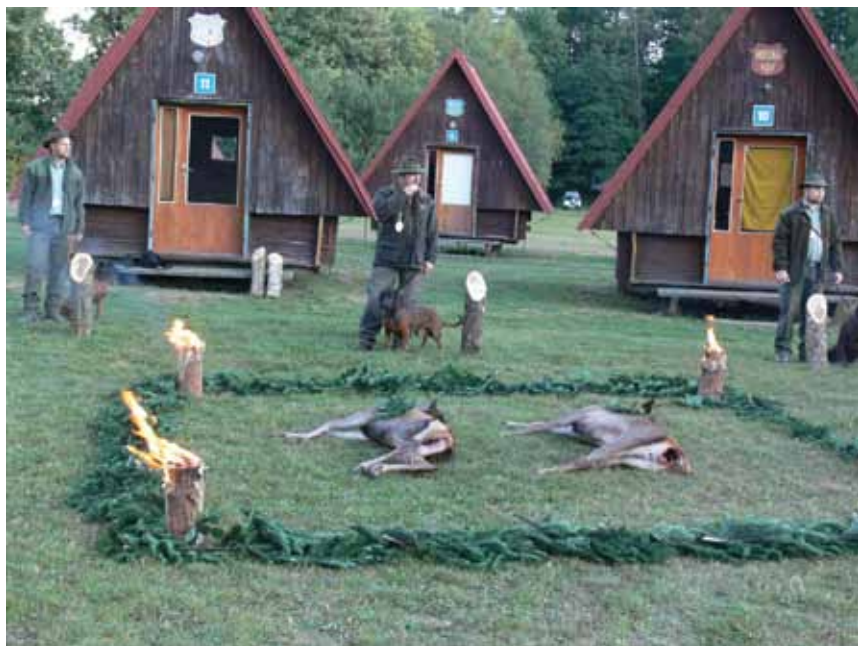
Aktéri II. ročníka skúšok farbiarov o cenu Hontu a Hrona pri výrade

Pracujem v kynológii aj v rámci SPZ a v regionálnej organizácii Rožňava-Revúca sa v tomto roku nenašlo dostatok psov na organizo-