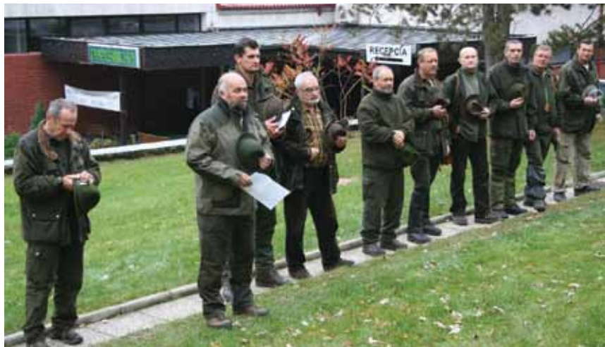
Pohľad na rozhodcovský zbor

Celkom získala 140 bodov, skončil bez ceny na 4. mieste v poradí.