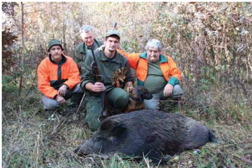
Úspešná dohľadávka CESSY z Prameňov Turca

Na tretí deň sme preverovali údajný postrel jelenčaťa, ktoré mohlo byť ale aj nemuselo zasiahnuté na spoločnej polovačke z posedu vo vysokej tráve cca 2 m, kde sa na tom istom mieste ulovili 3 kusy vy-