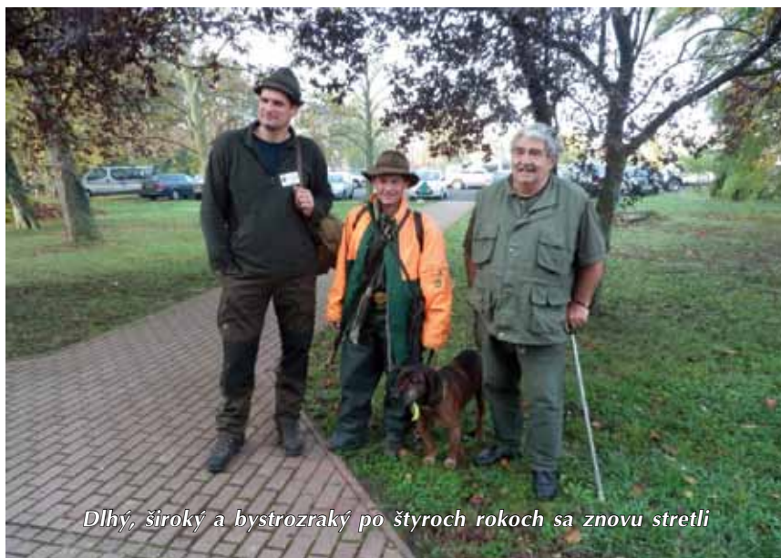
Dlhý, široký a bystrozraký po štyroch rokoch sa znovu stretli

mali farbu a potom zase nič. Po zhruba 700m prišiel vodič so sukou do zdravej diviacej zveri a tak chcel ísť ešte raz od nástreľu. Znova suka zobrala ten smer ako pred tým, no asi o 70 metrov nižšie a po 500m prišla na ležovisko odkiaľ vylomil kus vysokej. Na ležovisku bolo veľa čerstvej farby, zak dostal pokyn na vypustenie suky. Durenie trvalo asi 10 min. a stávanie 20 min. po prvý pokus o dostrelenie. Potom smerovalo durenie rovno do dediny medzi domy, kde sa nám podarilo jelienka pacifikovať a dať mu zaraz, nakoľko rana z pušky by tu bola nebezpečná. Celkovo bola suka hodnotená z práce na remeni známkou 2,5, durenie 3, stávanie 3 a správanie pri zastrelenej zveri 3,5. Teda 156b. v II. cene.