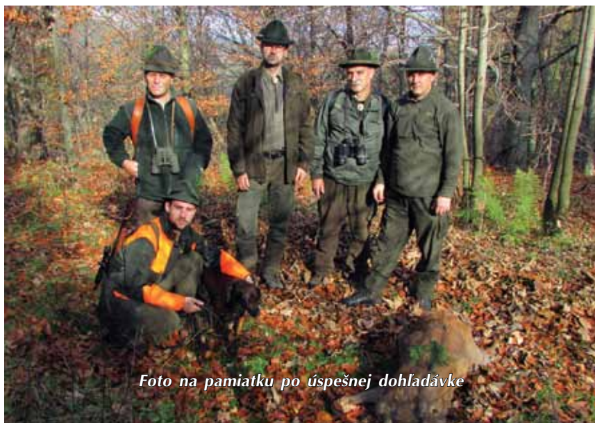
Foto na pamiatku po úspešnej dohľadávke