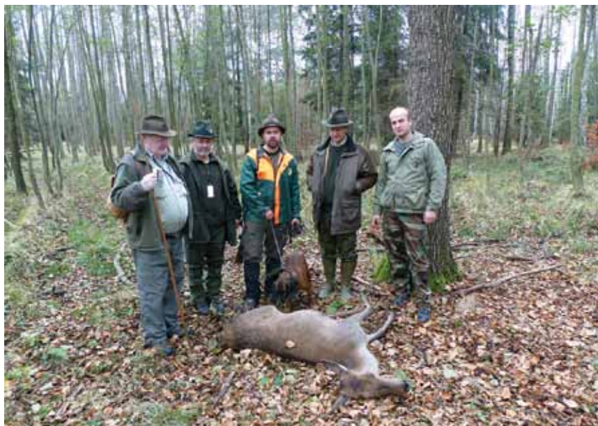
Foto na pamiatku po úspešnej dohľadávke