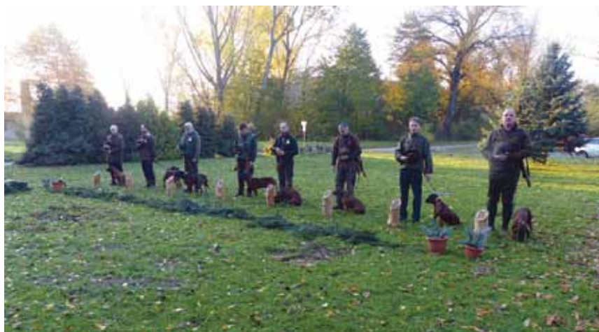
Pohľad na aktérov skúšok počas slávnostného otvorenia

viačik sa z mladiny vylomil a naháňačka pokračovala až do deviateho kilometra, kde pes znova diviačika staval v prehustenej mladine z prirodzeného zmladenia, kde sa nedalo dostreliť tak, aby nebol ohrozený pes. Diviačik sa znova dal na únik, pes ho nasledoval odhadom ďalšie 1–2 km. Potom, vzhľadom k subjektívnym okolnostiam – pes nedokázal zastaviť diviačika na dostrelovú vzdialenosť bez možného ohrozenia psa, vitálne správanie diviačika nerozoznateľné od zdravého kusa – bol pes odvolaný zo stopy a zver ostala nedohľadaná.